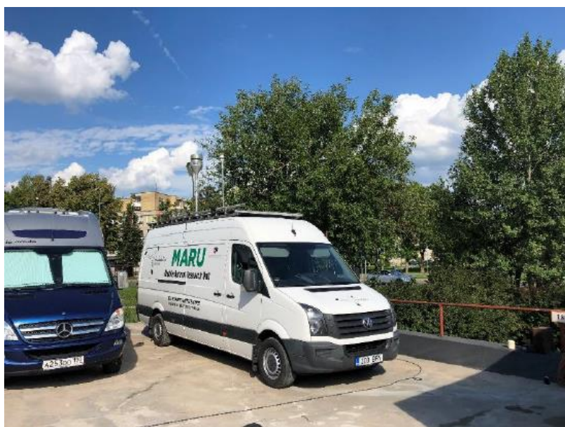
1 paveikslas. Mobilioji transporto priemonė ir tyrimo vieta

UAB „Vilniaus kogeneracinė jėgainė“ užsakė 24 valandų trukmės aplinkos oro kokybės vertinimo ir stebėjimo tyrimą Vilniaus miesto Lazdynų seniūnijos gyvenamajame rajone. Tyrimas atliktas 2019 08 20 – 2019 08 21 dienomis. Matavimai atlikti ir oro kokybė įvertinta vietoje, kurios koordinatės – 54°40'03.3"N; 25°12'56.1"E (žr. 1 ir 4 paveikslus). Matavimo rezultatai surinkti siekiant nustatyti oro teršalų koncentracijos dydį aplinkos ore bei įvertinti toliau pateiktų teršalų kiekį: vandenilio chlorido (HCl), vandenilio fluorida (HF), amoniako (NH 3 ), benzo(a)pireno (B(a)P), dioksinų (PCDDs) ir furanų (PCDFs).