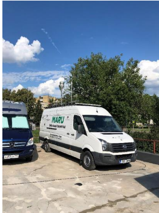
3 paveikslas. Mobilioji transporto priemonė ir tyrimo vieta