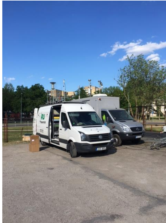
3 paveikslas. Mobilioji transporto priemonė ir tyrimo vieta