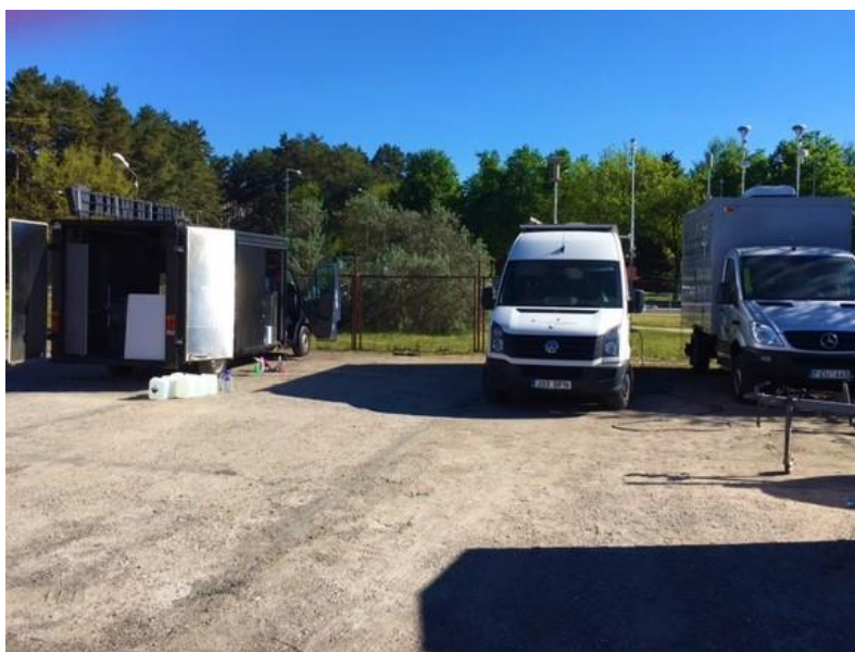
1 paveikslas. Mobilioji transporto priemonė ir tyrimo vieta

UAB „Vilniaus kogeneracinė jėgainė“ užsakė 24 valandų trukmės aplinkos oro kokybės vertinimo ir stebėjimo tyrimą Vilniaus miesto Lazdynų seniūnijos gyvenamajame rajone. Tyrimas atliktas 2017 05 22 – 2017 05 23 dienomis. Matavimai atlikti ir oro kokybė įvertinta vietoje, kurios koordinatės – 54°40'03.3"N; 25°12'56.1"E (žr. 1 ir 3 paveikslus). Matavimo rezultatai surinkti siekiant nustatyti oro teršalų koncentracijos dydį aplinkos ore bei įvertinti toliau pateiktų teršalų kiekį: vandenilio chlorido (HCl), vandenilio fluorida (HF), amoniako (NH 3 ), benzo(a)pireno (B(a)P), dioksinų (PCDDs) ir furanų (PCDFs). Taip pat tyrimo metu atlikti vietos meteorologinių parametų matavimai.