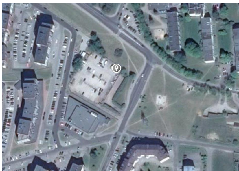
4 paveikslas. Matavimų vieta