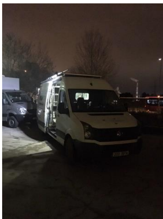
1 paveikslas. Mobilioji transporto priemonė ir tyrimo vieta

UAB Vilniaus kogeneracinė jėgainė užsakė 24 valandų trukmės aplinkos oro kokybės vertinimo ir stebėjimo tyrimą Vilniaus miesto Lazdynų seniūnijos gyvenamajame rajone. Tyrimas atliktas 2019 11 20 – 2019 11 21 dienomis. Matavimai atlikti ir oro kokybė įvertinta vietoje, kurios koordinatės – 54°40'03.3"N; 25°12'56.1"E (žr. 1 ir 2 paveikslus). Matavimo rezultatai surinkti siekiant nustatyti oro teršalų koncentracijos dydį aplinkos ore bei įvertinti toliau pateiktų teršalų kiekį: vandenilio chlorido (HCl), vandenilio fluorida (HF), amoniako (NH 3 ), benzo(a)pireno (B(a)P).