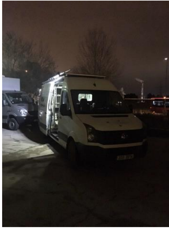
2 paveikslas. Mobilioji transporto priemonė ir tyrimo vieta