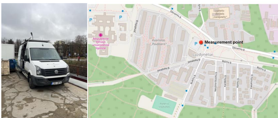
1 pav. Mobilioji laboratorija ir tyrimo vieta

UAB Vilniaus kogeneracinė jėgainė užsakė 24 valandų trukmės aplinkos oro kokybės vertinimo ir stebėjimo tyrimą Vilniaus miesto Lazdynų seniūnijos gyvenamajame rajone. Tyrimas atliktas 2023.11.14–2023.11.15. Matavimai atlikti ir oro kokybė įvertinta vietoje, kurios koordinatės – 54°40'03.3"N; 25°12'56.1"E (žr. 1 pav.). Matavimo rezultatai surinkti siekiant nustatyti oro teršalų koncentracijos dydį aplinkos ore bei įvertinti toliau pateiktų teršalų kiekį: vandenilio chlorido (HCl), vandenilio fluorida (HF), amoniako (NH 3 ), benzo(a)pireno (B(a)P).