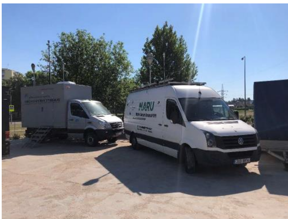
1 paveikslas. Mobilioji transporto priemonė ir tyrimo vieta

UAB Vilniaus kogeneracinė jėgainė užsakė 24 valandų trukmės aplinkos oro kokybės vertinimo ir stebėjimo tyrimą Vilniaus miesto Lazdynų seniūnijos gyvenamajame rajone. Tyrimas atliktas 2019 05 23 – 2019 05 24 dienomis. Matavimai atlikti ir oro kokybė įvertinta vietoje, kurios koordinatės - 54°40'03.3"N; 25°12'56.1"E (žr. 1 ir 4 paveikslus). Matavimo rezultatai surinkti siekiant nustatyti oro teršalų koncentracijos dydį aplinkos ore bei įvertinti toliau pateiktų teršalų kieki: vandenilio chlorido (HCl), vandenilio fluorida (HF), amoniako (NH 3 ) ir benzo(a)pireno (B(a)P).