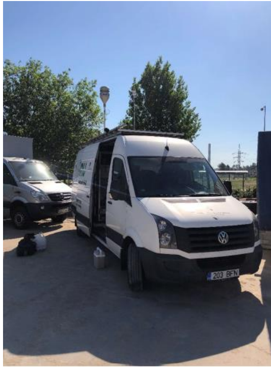
3 paveikslas. Mobilioji transporto priemonė ir tyrimo vieta